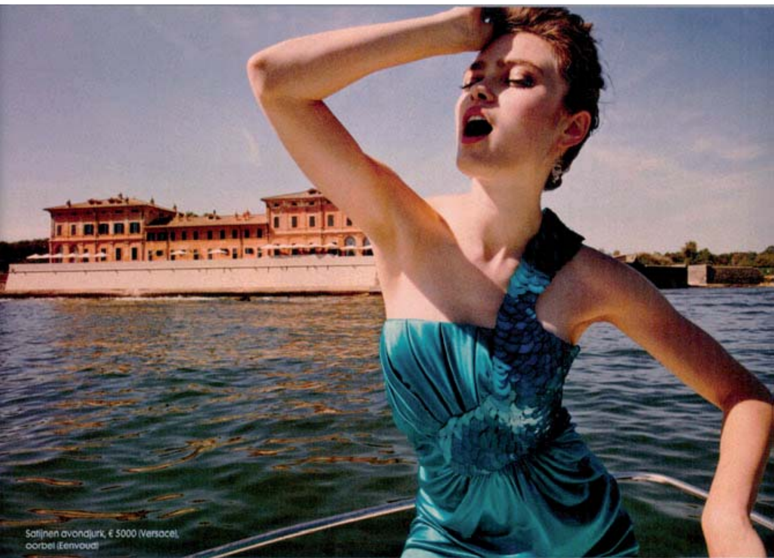
Satijnen avondjurk, € 5000 (Versace), oorbel (Eenvoud)