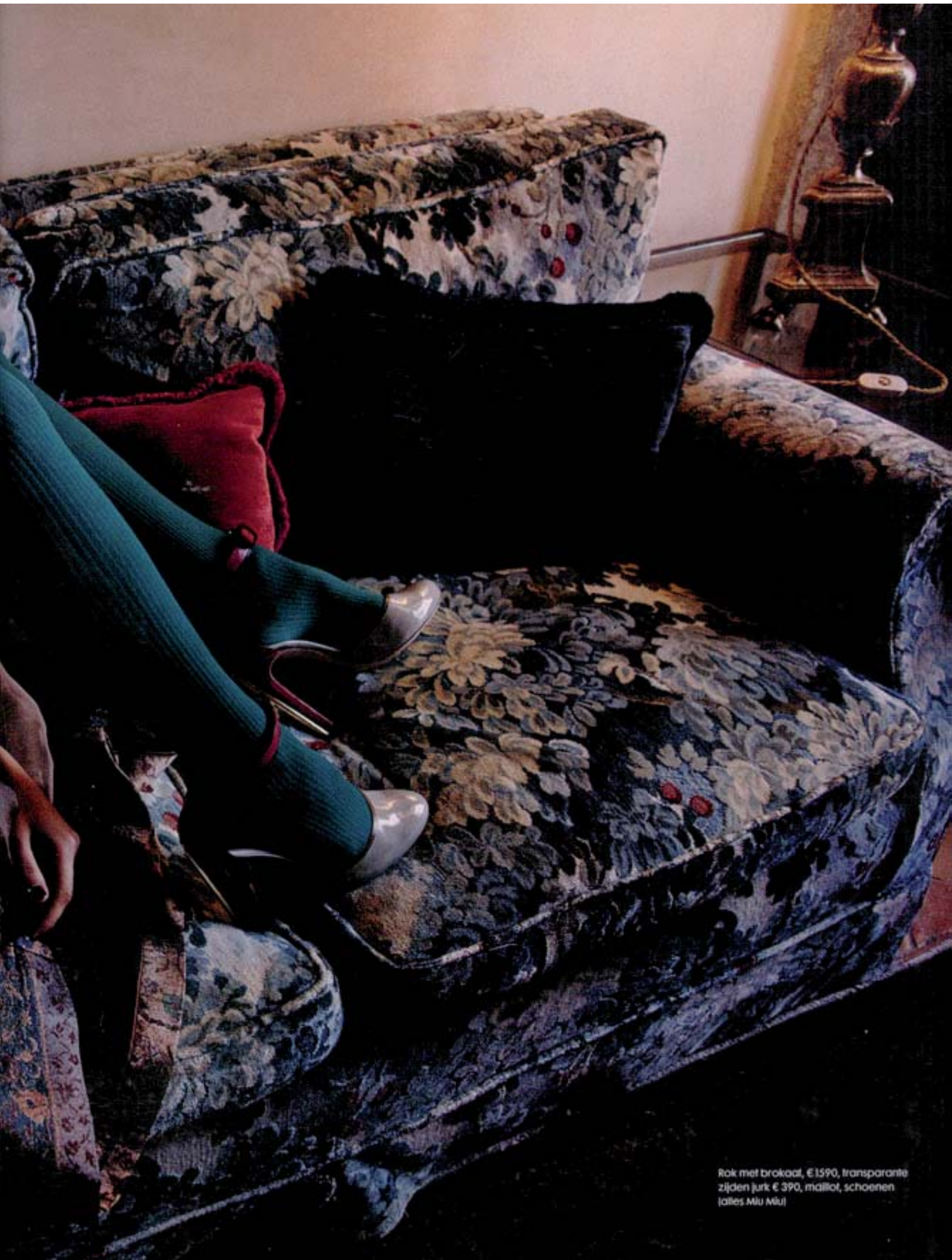
Rok met brokaad, € 1590, transparante zijden jurk € 390, maillot, schoenen (alles Miu Miu)