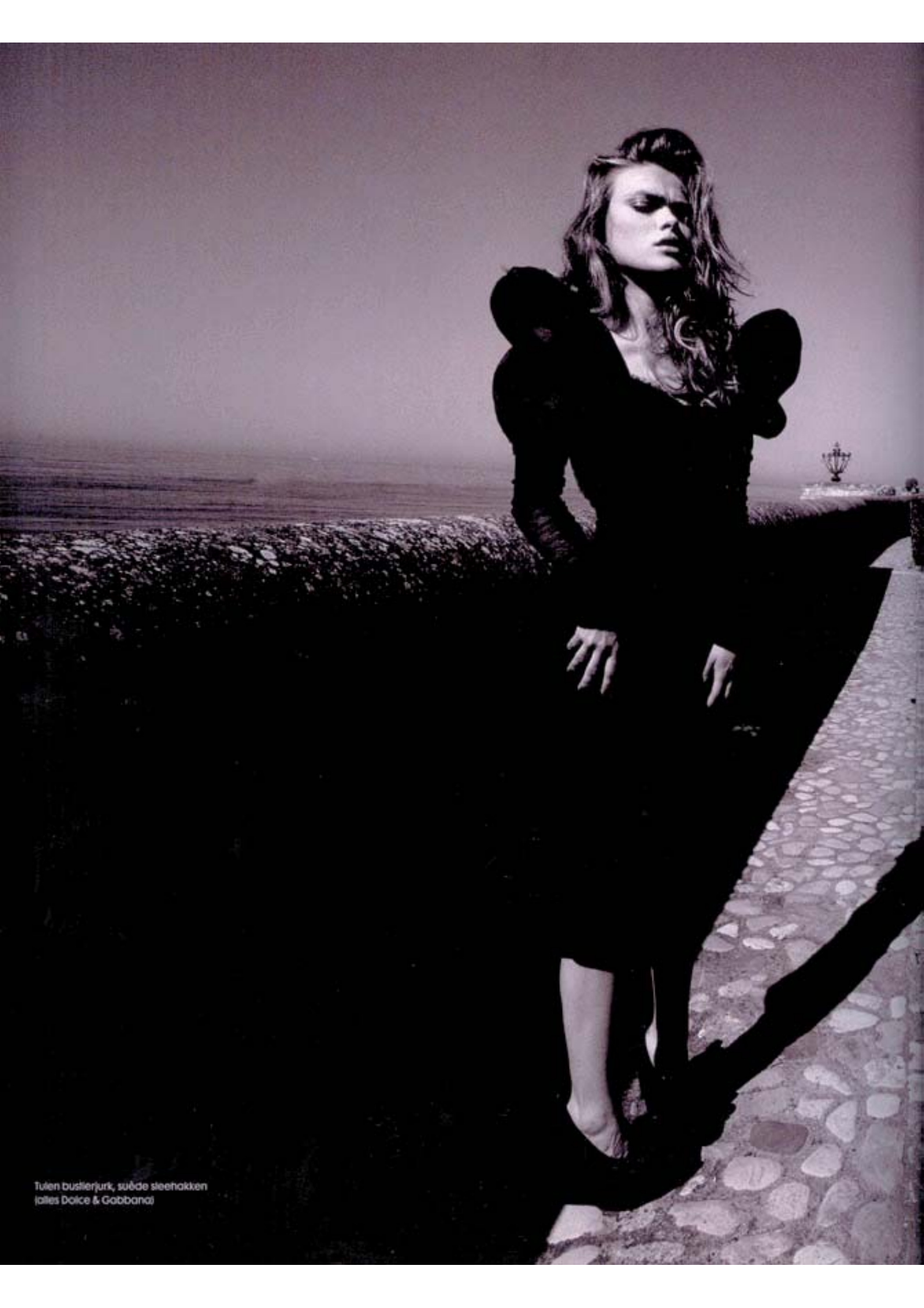
Tulen bustierjurk, suöde steehakken (alles Dolce & Gabbana)