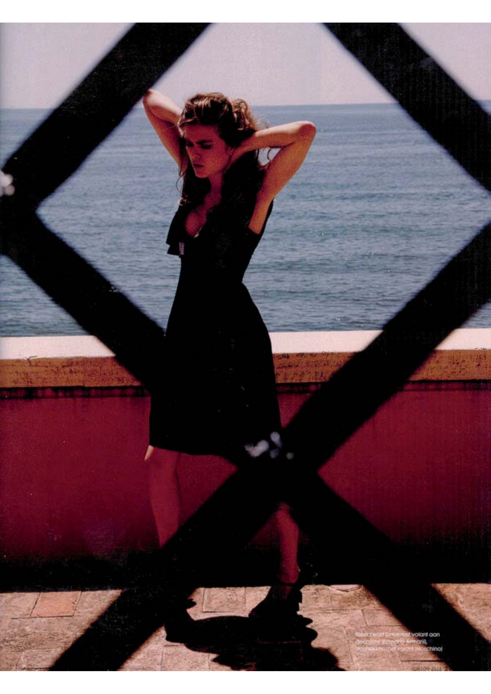
Best zwart jurkje met volant aan dekolleté (Valentino Armani), schoenen (Jas Gawronski)