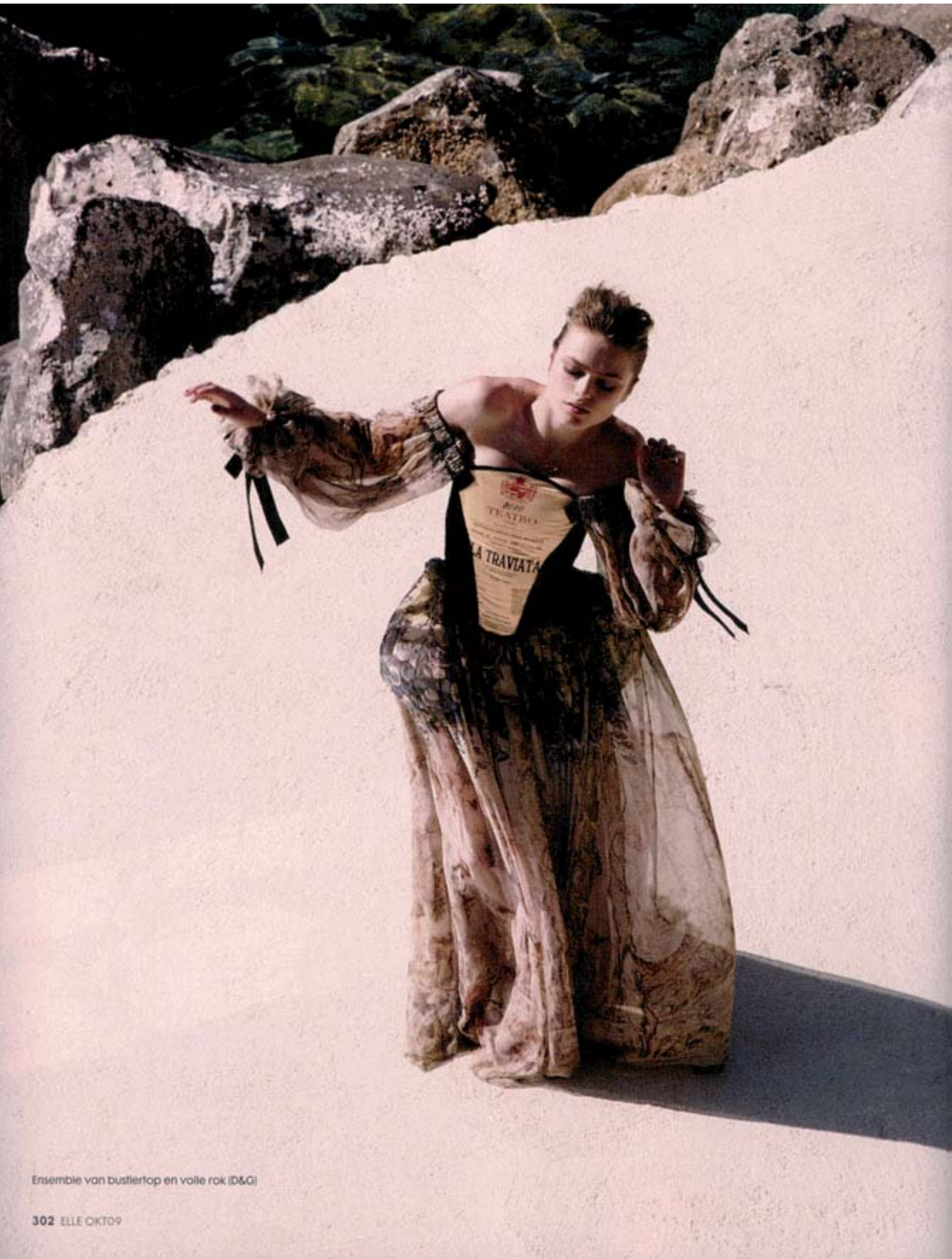
Ensemble van bustiertop en voile rok (D&G)