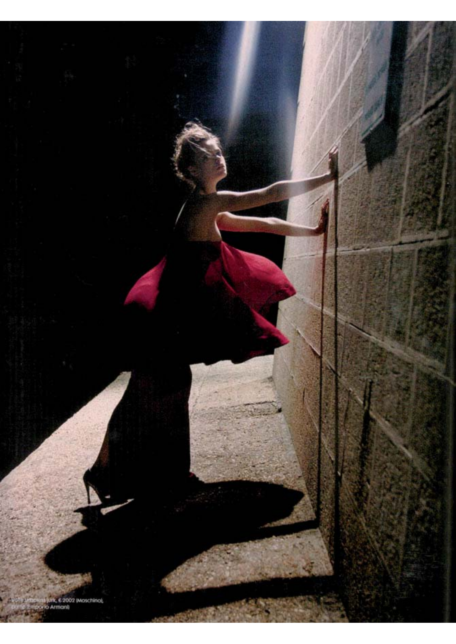
Veste Jeppies Jurk, € 2002 (Moschino), pump (Emporio Armani)